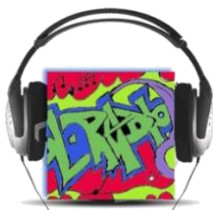
ΕΠΙΣΤΗΜΟΝΙΚΗ ΕΤΑΙΡΕΙΑ «European School Radio, Το πρώτο Μαθητικό Ραδιόφωνο»