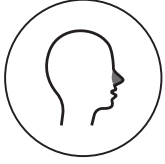
καταρροή, απώλεια όσφρησης/γεύσης