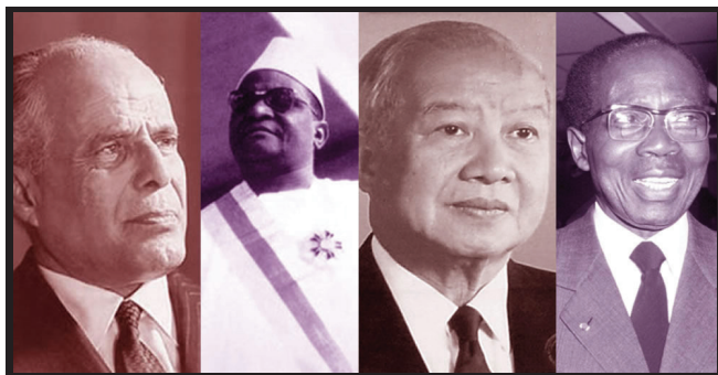
Léopold Sédar Senghor, Habib Bourguiba, Hamani Diori et le Prince Norodom Sihanouk du Cambodge pères fondateurs de la Francophonie institutionnelle

Pour marquer ce cinquantième anniversaire, d'autres manifestations auront lieu jusqu'à la fin de l'année et dont les dates vous seront communiquées ultérieurement.