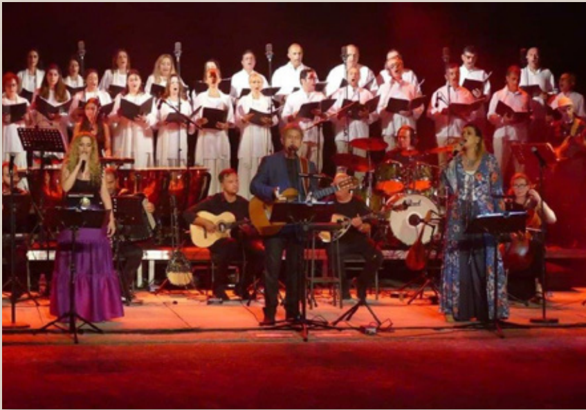
ΦΩΝΗΤΙΚΟ ΣΥΝΟΛΟ «ΔΙΑΣΤΑΣΗ»