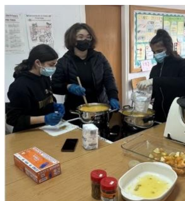
Μαθητές Γυμνασίου δημιουργούν διάφορα προϊόντα από τα εσπεριδοειδή που πέφτουν από τα δέντρα της περιοχής

Το ευρύτερο όραμά μας προσδιορίζεται από την έννοια του Ανοικτού Σχολείου: ενός σχολείου ανοικτού προς την κοινωνία, το οποίο εξελίσσεται σε παράγοντα ευημερίας της κοινότητας, αναπτύσσοντας συνεργασίες με πρόσωπα και φορείς στο τοπικό του περιβάλλον.