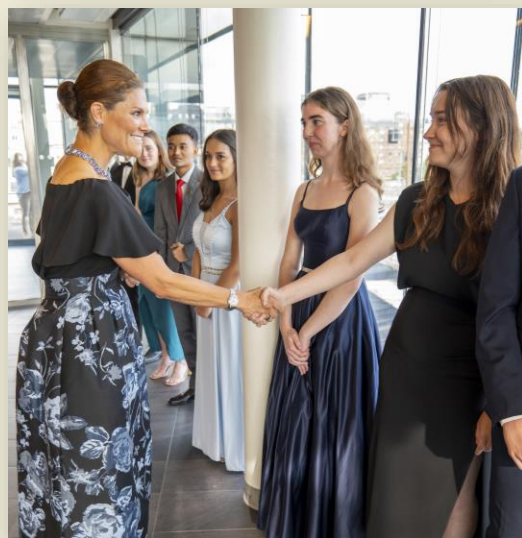
Η Πριγκίπισσα Βικτώρια της Σουηδίας με τους μαθητές που εκπροσώπησαν την Κύπρο το 2023