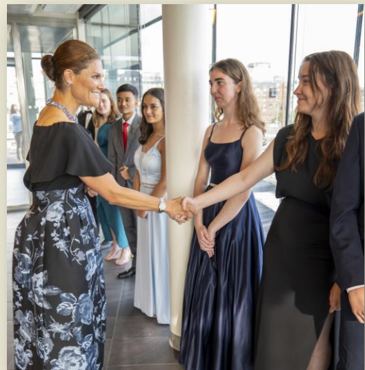
Princess Victoria of Sweden with the students who represented Cyprus in 2023