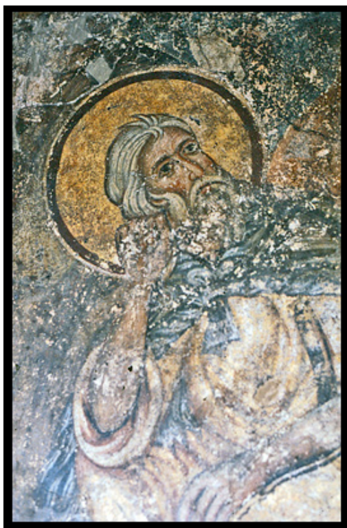
Σινά, τοιχογραφία από την Παλαιά Τράπεζα, ο προφήτης Ηλίας.