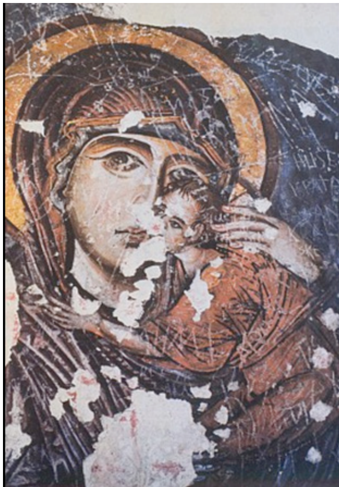
Κόραμα, Νέα Εκκλησία Tokali (953 - 963)